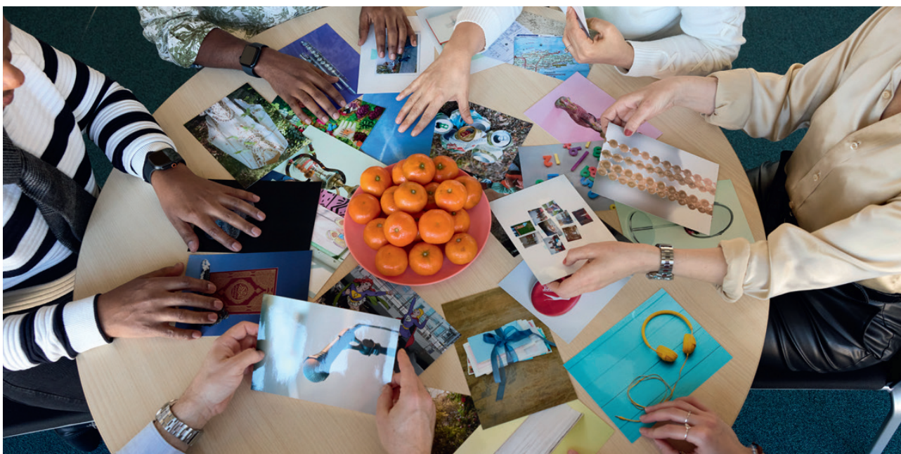
Männer und Frauen bei einer Gesprächsrunde zum Thema «Selbstwert stärken», 2025 in Sitten.

Unsere Vision ist eine Gesellschaft, in der alle Menschen – unabhängig von Herkunft oder Aufenthaltsstatus – gleichberechtigten Zugang zu Bildung, Gesundheitsversorgung und sozialer Teilhabe haben. Femmes-Tische / Männer-Tische versteht sich als Teil dieser gesellschaftlichen Verantwortung und engagiert sich langfristig und verlässlich für ein respektvolles, solidarisches und inklusives Zusammenleben.