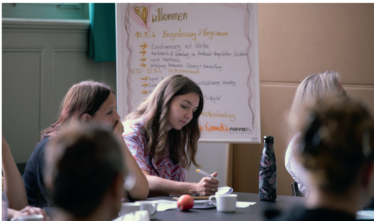
Standortleitende an der Schulung zum Thema «Feedback und Hospitation», Juni 2025, Bern.

Anfang 2025 standen wir vor einer grossen Herausforderung: Unsere Leistungsverträge mit drei Bundesämtern liefen Ende 2025 aus und der Bund stand unter enormem Spardruck. Umso grösser ist die Erleichterung, als im Dezember 2025 klar wurde, dass alle drei Verträge in die nächste Phase gehen. Herzlichen Dank für diese wichtige und nachhaltige Unterstützung (Bundesamt für Sozialversicherungen, Staatssekretariat für Migration und Bundesamt für Gesundheit). Es braucht mehr denn je Chancengerechtigkeit.